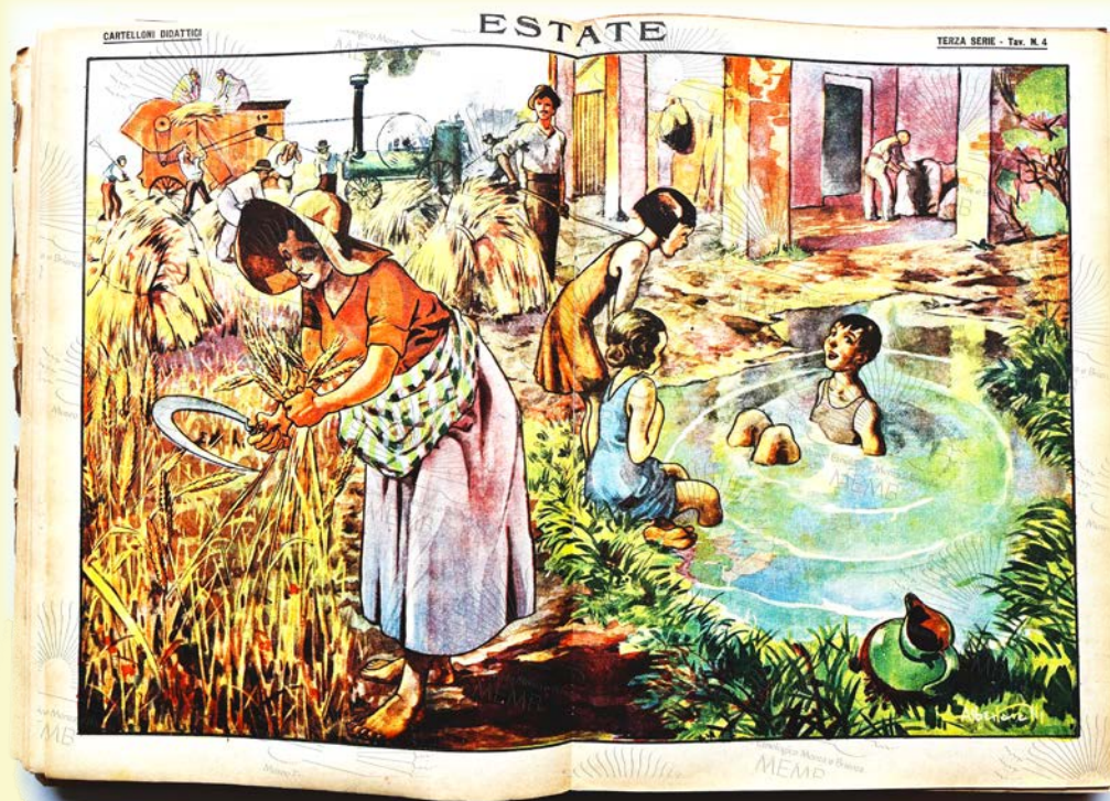
immagine estratta da un numero de il Cartoccino dei Piccoli del 26 giugno 1932 - Collezione MEMB

Uffici Villa Reale e Mulino Colombo dal 1 luglio al 4 settembre inclusi