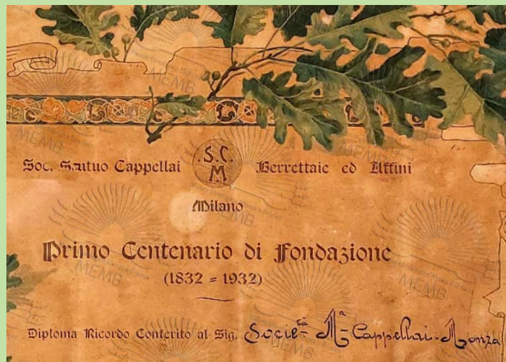
Diploma del Centenario di Fondazione della Società Cappelletti Monza 1832 - 1932. Conferito dalla S.C.M. di Milano.

In basso i particolari della medaglia d'argento del diploma per il primo premio del "Concorso allestimento vetrina della giornata del miele", 1936/37, vinto dalla drogheria Colombo allora ubicata sull'angolo esterno dell'edificio del Mulino Colombo. Il lato dritto riporta l'allegoria delle attività commerciali; il lato verso riproduce lo stemma della Città di Monza.