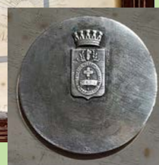
Tutti i pezzi riprodotti appartengono alla Collezione del MEMB