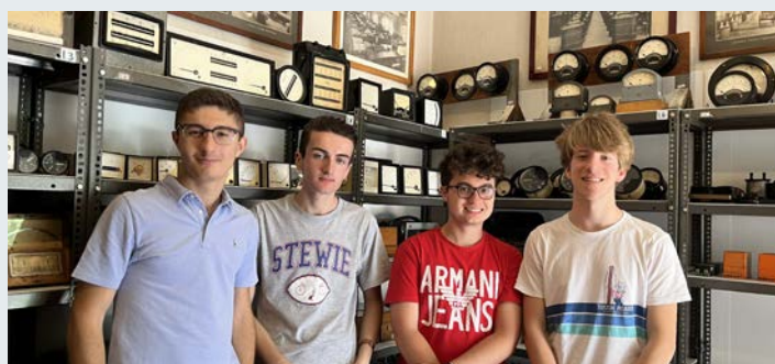
il team di studenti del Fermi che ha sviluppato la stanza CGS

Una volta raggiunto un numero significativo di stanze potranno essere visitate virtualmente a distanza dal sito del MEMB.